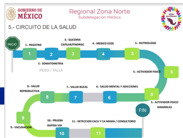
Circuito de salud